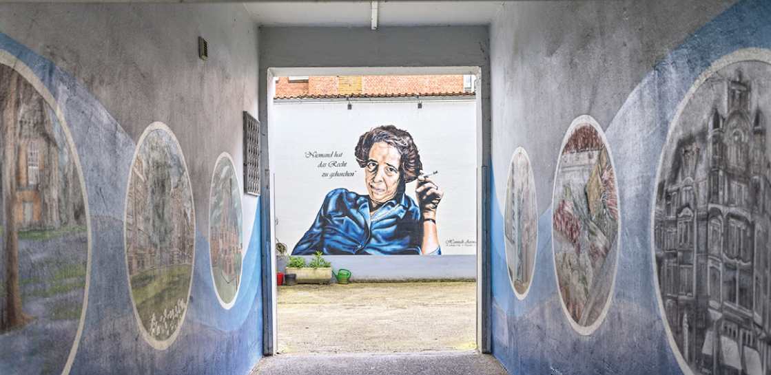
Hannah Arendt, Porträt im Hof ihres Geburtshauses