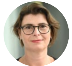
Christina Morina