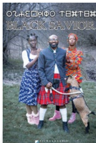
Filmplakat „Black Savior“ © Anian Krone, Johannes Krug