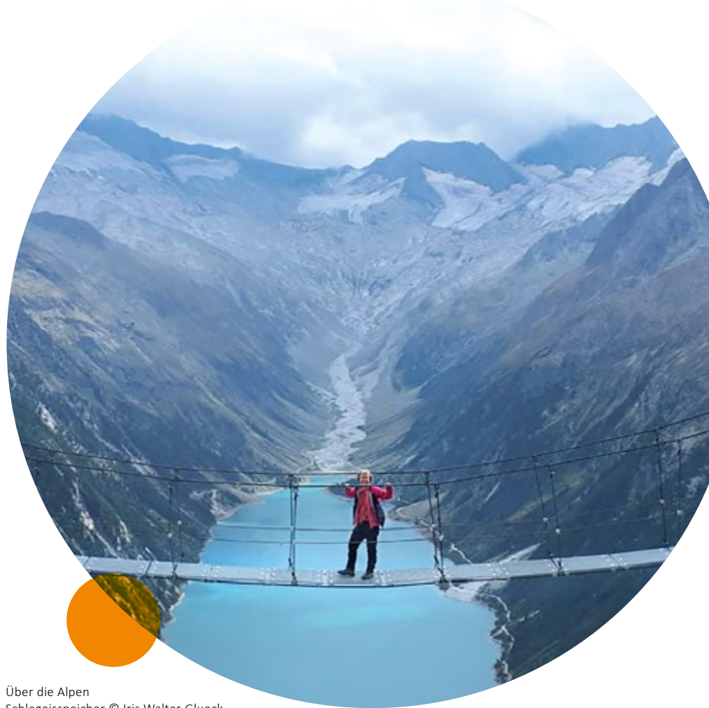
Über die Alpen Schlegeisspeicher