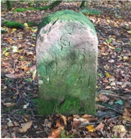
Grenzstein bei Löwenstein

Margarete Steiff: Firmengründerin und Powerfrau Di, 26.11.2024, 18 - 20.15 Uhr Leingarten, Karin Schmöger 8,- € 103A138