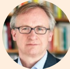
Albrecht von Lucke