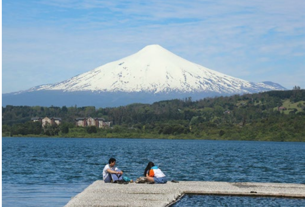
Chile, Vulkan Villarrica

Di, 3.12.2024, 19 - 20.30 Uhr Heilbronn, Ellen Keifer / Roland Arnold gebührenfrei 102A141