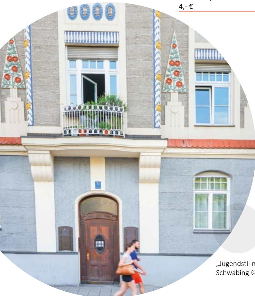
„Jugendstil made in Munich“ Schwabing